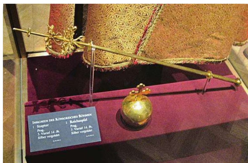
Žezlo a jablko Karla IV. Oba korunovační klenoty jsou uloženy ve vídeňském Hofburgu. Československý stát ani Česká republika o jejich vrácení nikdy nepožádaly.

Korunovační klenoty byly majetkem Země české bez ohledu na to, zda byly uloženy v Praze, nebo ve Vídni. Majetek Země české přešel na československý stát a následně na Českou republiku. Rakousko ví, že žezlo i jablko jsou českými korunovačními klenoty, proto nemůže uplatnit vydržení. Po vzniku Československa rakouský stát vydal dokumenty a věci patřící Zemi české, moravské a slezské uložené v rakouských institucích, pokud o ně českosloven-